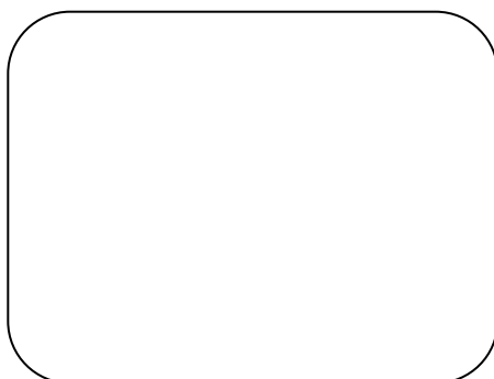
2. La Kena