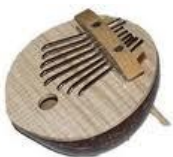
Le Sanza ou Kalimba