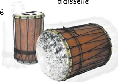
Le Dun dun ou Doum Doum