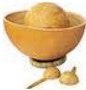
Le tambour d'eau