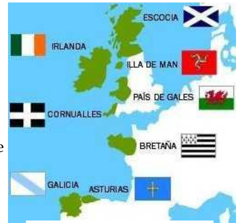
Les pays de culture Celtes

On peut reconnaître cette musique grâce à ses instruments typiques (voir feuille instruments).